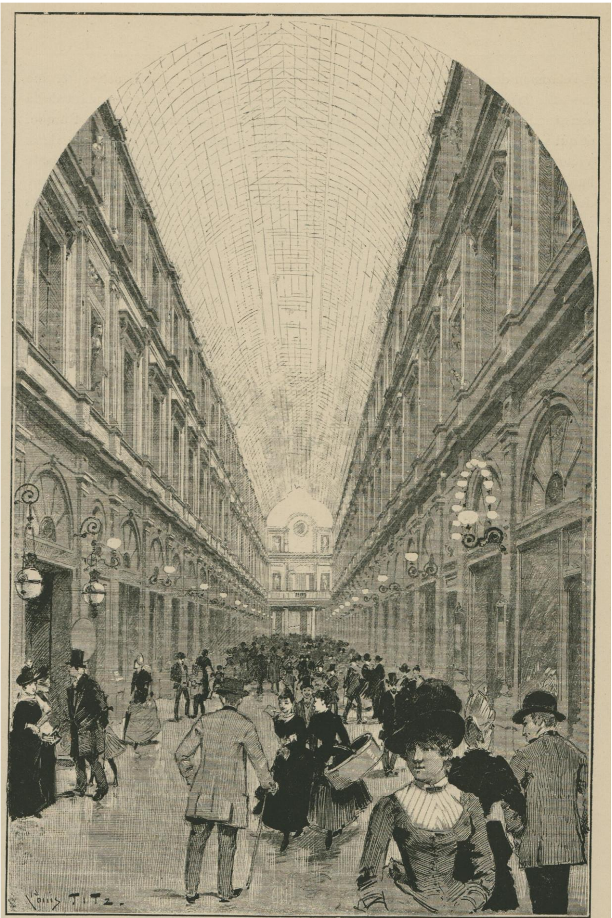
LES GALERIES SAINT-HUBERT. — LA GALERIE DU ROI. Dessin original de L. Titz.